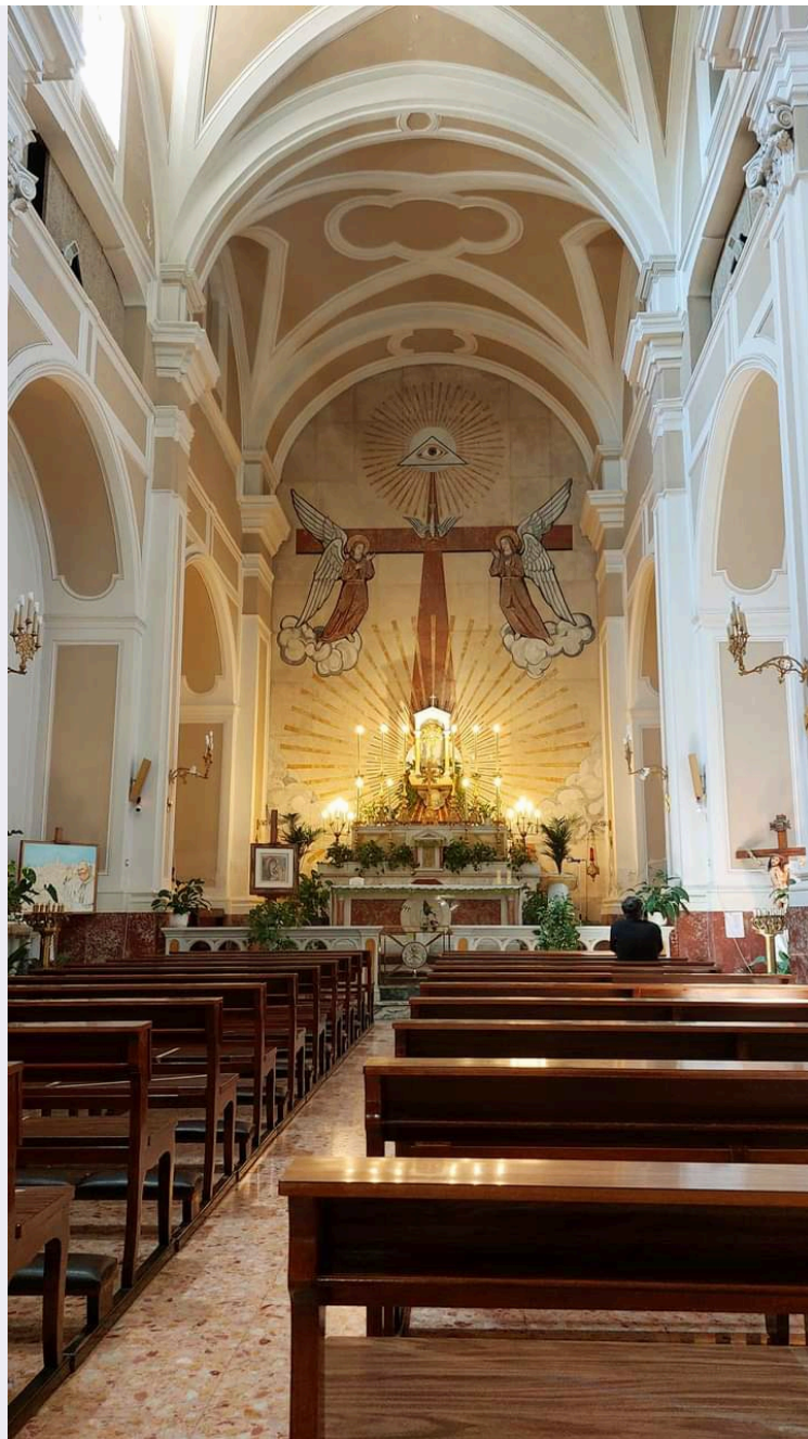
Sacra Famiglia con Santa Elisabetta e San Giovannino.jpg