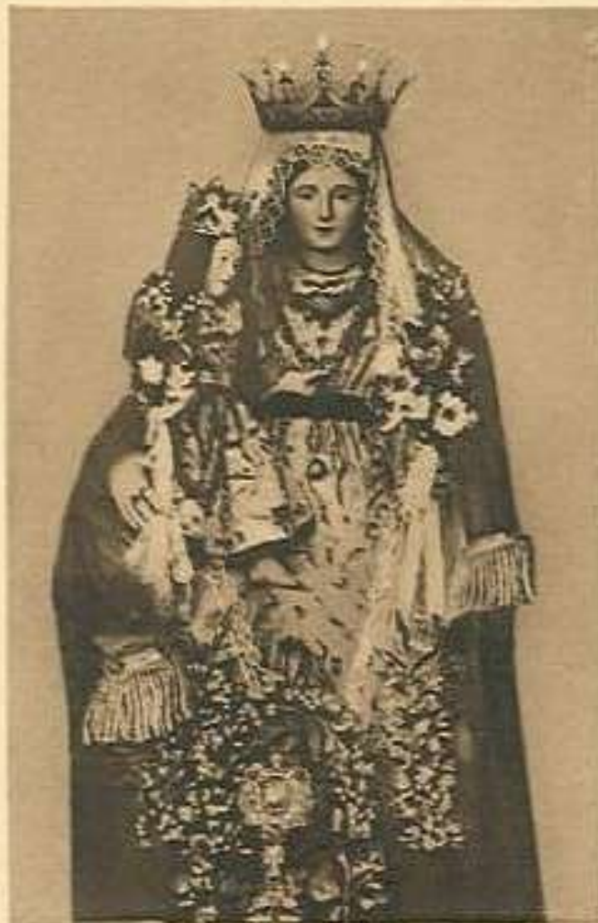
S. MARIA DI MEZZOGIORNO Antica e Prodigiosa Immagine incoronata solennemente l'anno 1797, che si venera nella Chiesa Parroc. omonima in Catanzaro (si festeggia il 15 agosto)

Immaginetta Santa Maria di Mezzogiorno.jpg