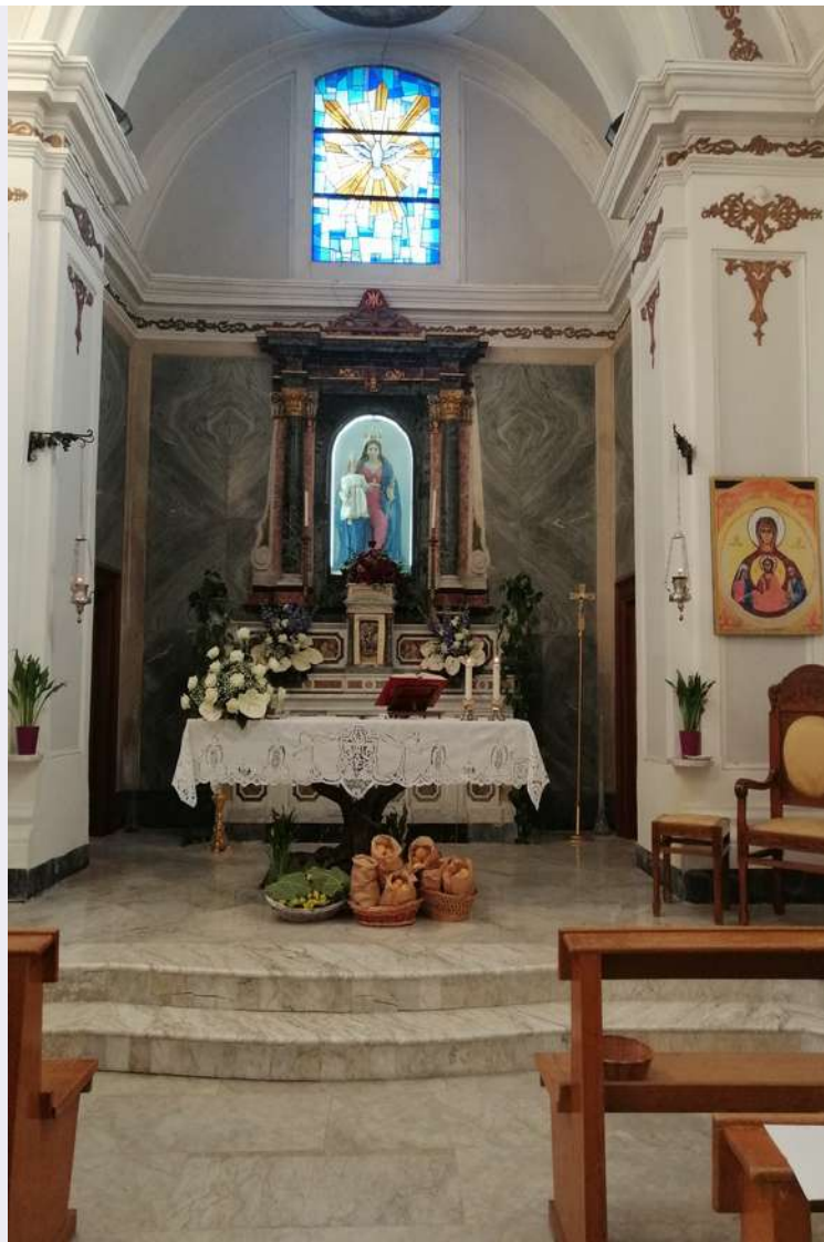
Altare Santa Maria di Mezzogiorno.jpg