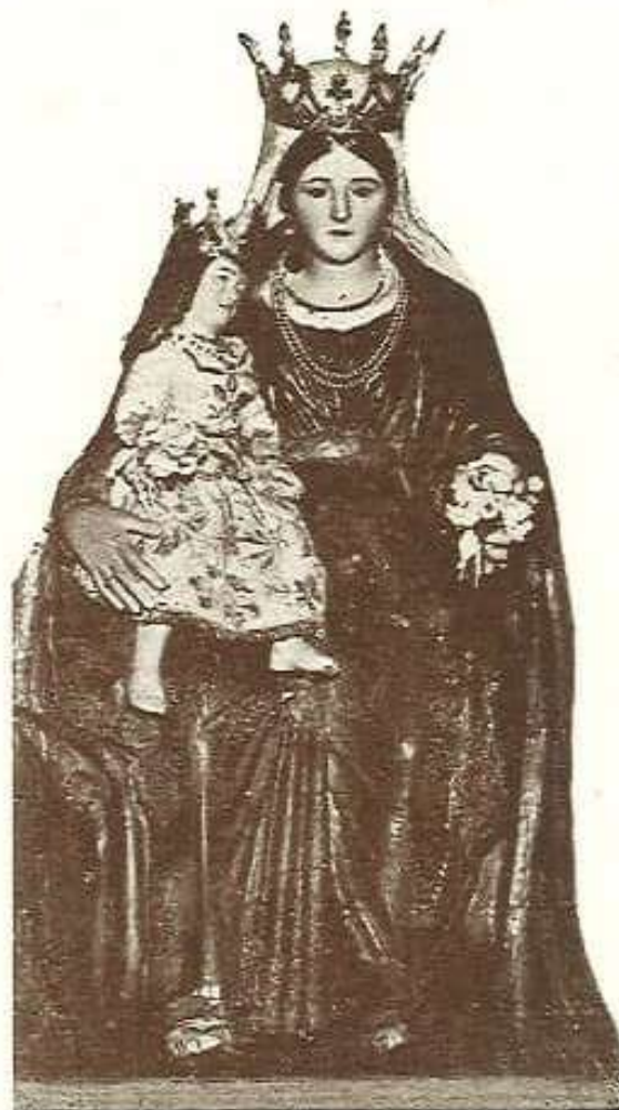
S. Maria di Mezzogiorno Antica e Prodigiosa Immagine incoronata solennemente l'anno 1797 che si venera in Catanzaro nella Chiesa Parrocchiale omonima (Si festeggia il 15 Agosto)

Immagine della Madonna di Mezzogiorno.jpg