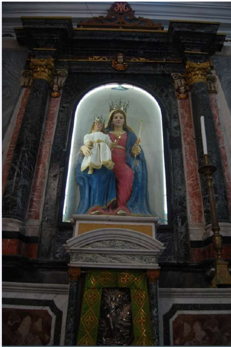
Statua Santa Maria di Mezzogiorno.jpg