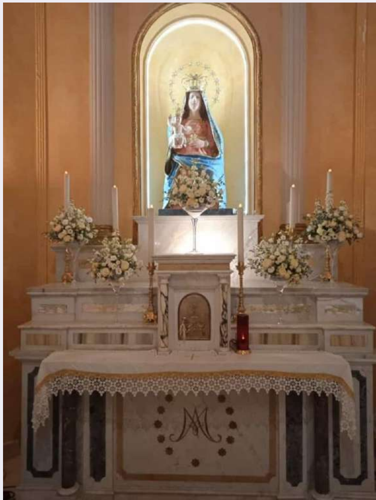
Statua in pietra.jpg