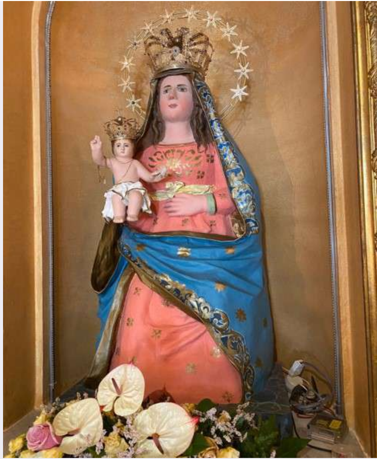
Particolare sacra effigie.jpg