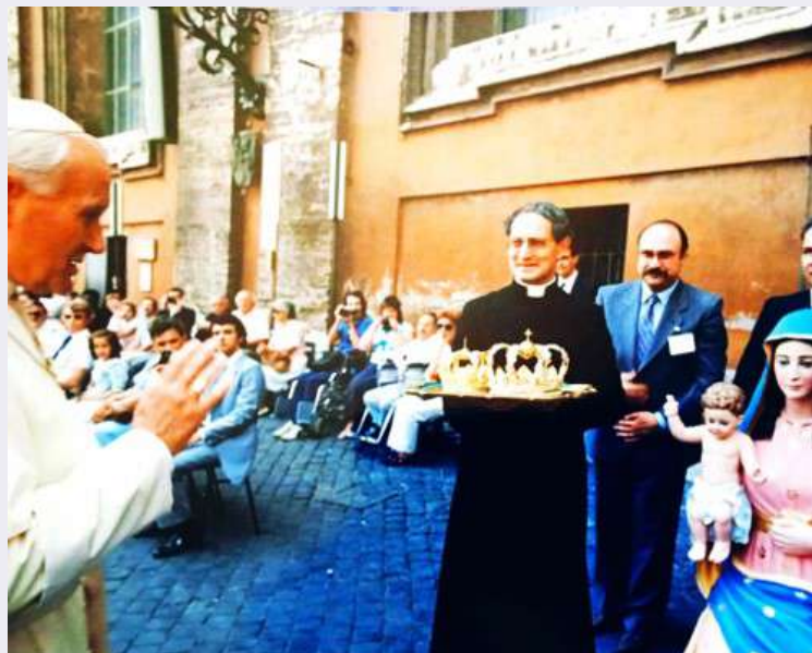
Giovanni Paolo II.jpg