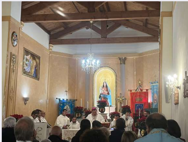
Santuario prima del restauro.jpg