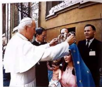
San Giovanni Paolo II incorona la Statua della "Madonna della Rocca".